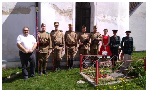
Pietní akt 8. 5. 2021 v Maršově a na Šmelcovně