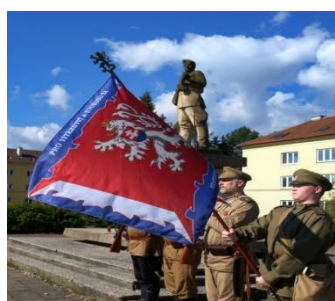
Pietní akty ve městě Kuřimi 8. 5. 2021