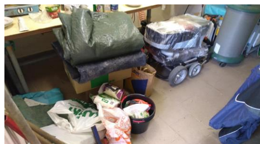
Sbírka materiální pomoci pro postiženou Moravu v Kuřimi a v Maršově