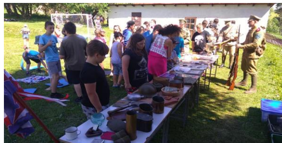
Přednáška na ZŠ Dušejov u Jihlavy