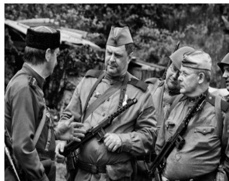
Ořechov u Brna – Ořechovská operace 1945