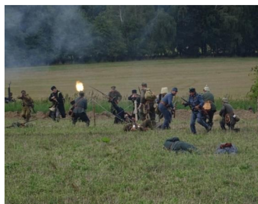
Mladějov – Blosdorf 1915 – 2022