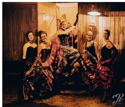
Mladějov – Blosdorf 1915 – 2022

V sobotu 3. září jsme pak rozbili tábor a odprezentovali náš spolek a ČS legie na Rusi na okrskovém dětském dni s hasiči v Deblíně.