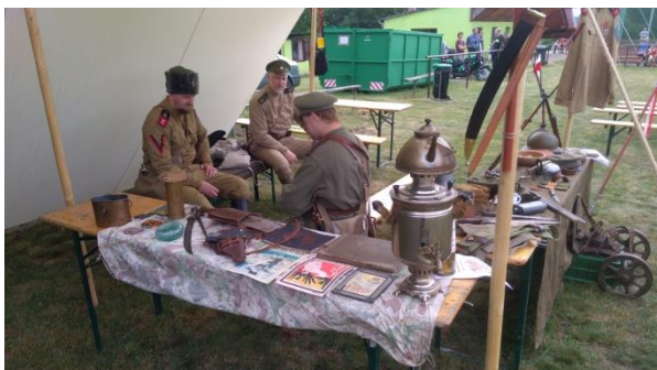
Dětský den v Maršově a v Hradčanech u Tišnova

14. července jsme spolu s četníky a dalším osazenstvem Četnické stanice Kuřim navštívili Legiovlak při jeho zastávce v Kuřimi.