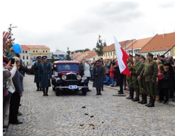
Městské slavnosti v Třebíči

Při návratu z Třebíče jsme ještě navštívili Legiovlak na jeho zastávce v Tišnově. Byla to již naše pátá návštěva v Legiovlaku a vždy je co objevovat. Rovněž setkání a poklábosení s osádkou vlaku je vždy příjemnou záležitostí.