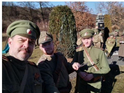
Zimní tažení 1916, obec Rozhraní, 1. 2. 2025

Sobotu 26. 4. 2025 jsme strávili v Brně na hradě Špilberk, kde se konala velká akce „Krvavé jaro 1945 – svoboda přijela na koních“ pořádaná k osmdesátému výročí osvobození naší vlasti. K vidění byly tábory sovětské a německé armády, výstavky výstroje a výzbroje, obrovská spousta techniky, včetně raritních kusů jako tank T 34/76, stíhač tanků Jagdpanzer 38 (t) Hetzer, či polopás Sd.Kfz. 8 Famo. Večer proběhla v prostorách hradu multimediální bojová ukázka.