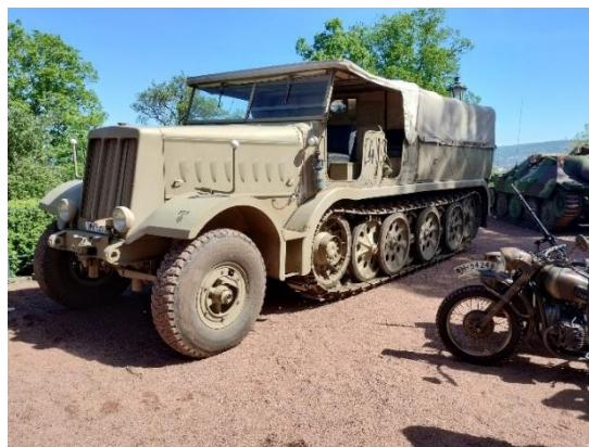
Krvavé jaro 1945, hrad Špilberk, 26. 4. 2025