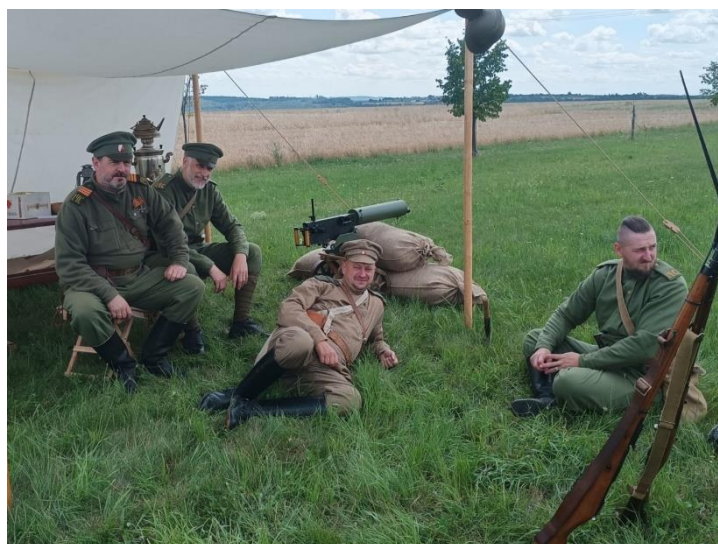
První ročník akce Letní ofenziva Maršov 1917 – 2025, maršovské hřiště, 2. srpna 2025