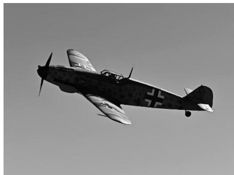
Krvavé jaro 1945, Černovická pískovna, 27. 4. 2025