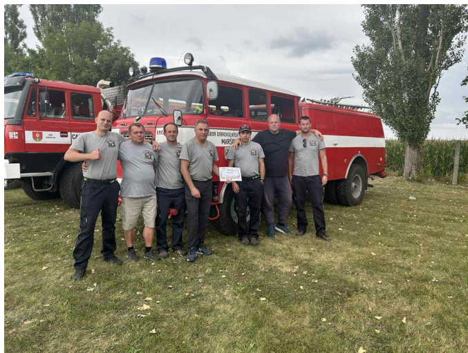
Družstvo SDH Maršov, okrskový dětský den s hasiči, Svatoslav 30. 8. 2025

V sobotu 30. 8. se na hřišti v obci Svatoslav konal čtvrtý ročník okrskového dětského dne s hasiči. Pro děti bylo připraveno několik soutěžních stanovišť a všechny po splnění zadaných úkolů obdržely zaslouženou sladkou odměnu. Součástí dne byla jako každoročně i soutěž v požárním sportu. Naše družstvo se s časem 27,6 vteřin umístilo na čtvrtém, předposledním místě. Družstvo SDH Maršov ovšem závodilo s mašinou PS 8 a v konkurenci okolních týmů s mnohem silnějšími mašinami PS 12 jsme byli pouhých 0,7 vteřiny od druhého místa, což lze považovat za úspěch.