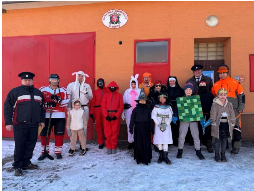
Maškary před hasičkou. Ostatky 22. 2. 2025

22. února 2025 uspořádal náš sbor tradiční ostatky neboli masopustní veselici. Přes den jako každý rok vyrazil po obci průvod maškár a večer se konala ostatková veselice s kapelou J-Band v Hostinci Na posedu.