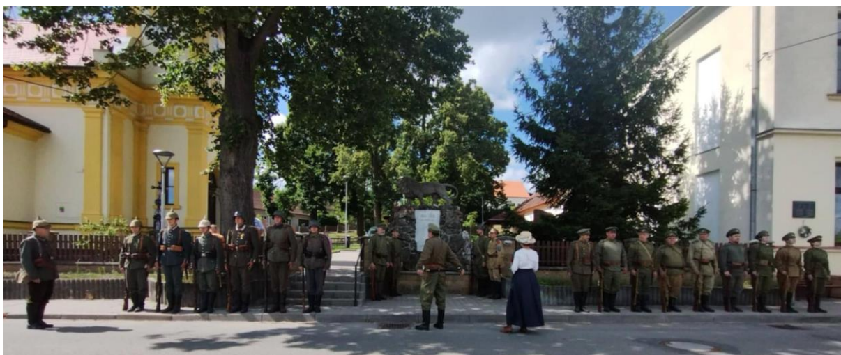
Letní ofenziva Maršov 1917 – 2025, pietní akt u pomníku padlých občanů v první a druhé světové válce, Maršov, 2. srpna 2025