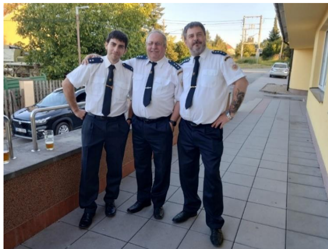
Zástupci SDH Maršov na oslavách 130 výročí SDH Deblín

14. června se zástupci našeho sboru zúčastnili oslav 130. výročí sboru dobrovolných hasičů v Deblíně.